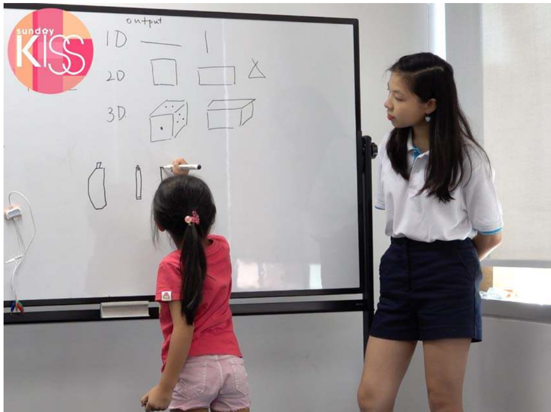
老師在課堂時以輕鬆手法教導小朋友一些電子知識。